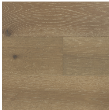
Happy Hour (CS-27)