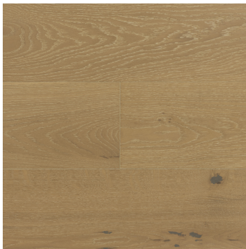
Sand Bar (CS-23)