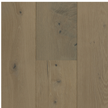
Beach House (CS-20)