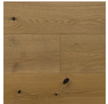
Rosé All Day (CS-28)